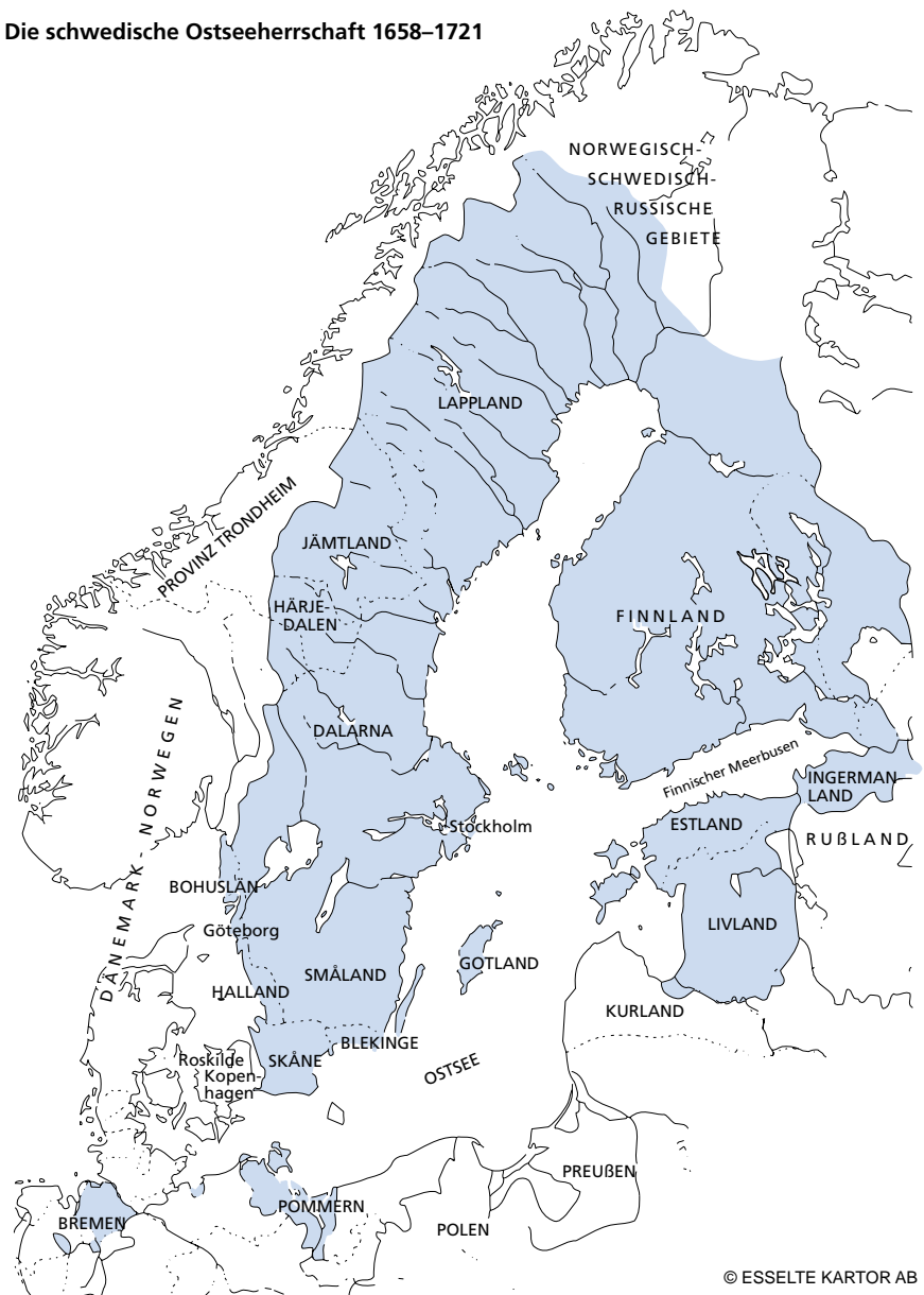
Im Zeitraum von 1658 bis 1721 war Schweden eine Großmacht im nördlichen Europa. Im Westfälischen Frieden wurde Schweden in Osnabrück 1648 zugeschrieben: Vorpommern mit Rügen, ein Teil Hinterpommerns entlang dem Ostufer der Oder mit Stettin, Wismar mit entsprechendem Hinterland und die Herzogtümer Bremen (ohne Reichsstadt) und Verden. Nach den Niederlagen im Großen Nordischen Krieg 1700–21 verlor Schweden seine Provinzen südlich und östlich des Finnischen Meerbusens sowie in Deutschland bis auf einen kleinen Teil Pommerns.

Kommissionstätigkeit wurde 1974 eine neue Regierungsform angenommen, der zufolge alle Staatsgewalt vom Volke ausgeht, das in freier und geheimer Wahl den Reichstag bestimmt. Dieser verabschiedet allein Gesetze und hat das Recht, Steuern zu erheben. Die Regierung wird vom Reichstag bestätigt, dem sie auch verantwortlich ist. Der König bleibt Staatsoberhaupt, seine Tätigkeit jedoch beschränkt sich auf rein repräsentative Aufgaben. Auf Gustaf VI. Adolf, der den Thron 1950 bestieg, folgte bei dessen Tod 1973 mit Carl XVI. Gustaf der erste schwedische König, der gemäß der neuen Verfassung „regierte“. Durch eine Änderung des Thronfolgesetzes wurde 1980 gleiches Erbrecht für Männer und Frauen eingeführt, so dass Prinzessin Victoria an Stelle ihres jüngeren Bruders Carl Philip zur Thronfolgerin wurde.